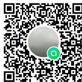
พื้นที่สัดหีบ