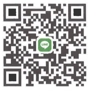
พื้นที่สัตหีบ