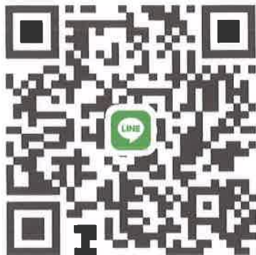
พื้นที่พุทธมณฑล