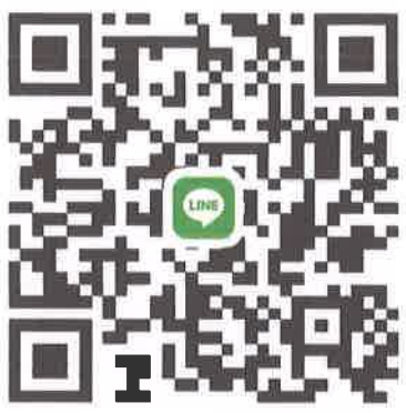
พื้นที่พุทธมณฑล