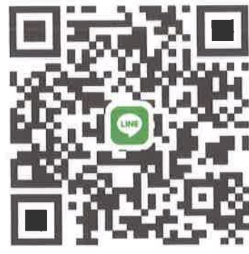
พื้นที่สัตหีบ