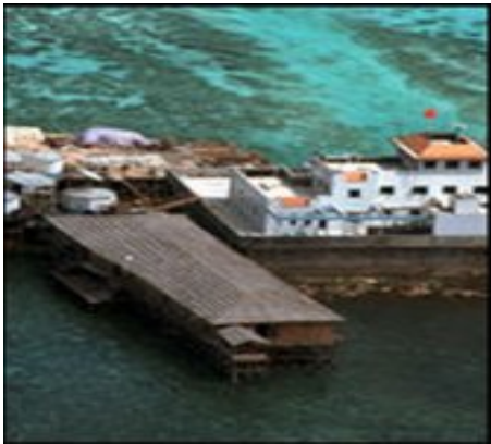
รูป สิ่งปลูกสร้างของจีนบนไซดหิน Mischief Reef

หมู่เกาะนี้และเหตุผลทางภูมิศาสตร์เนื่องจากหมู่เกาะนี้อยู่ใกล้ฟิลิปปินส์มากที่สุด เวียดนามอ้างเหตุผลทางประวัติศาสตร์ เช่นเดียวกับ สเปน และไต้หวัน ส่วนมาเลเซีย และบรูไน อ้างเหตุผลทางภูมิศาสตร์คือมีพื้นที่บางส่วนทางใต้ของหมู่เกาะ อยู่ในเขตไหล่ทวีปของตนเอง ๔