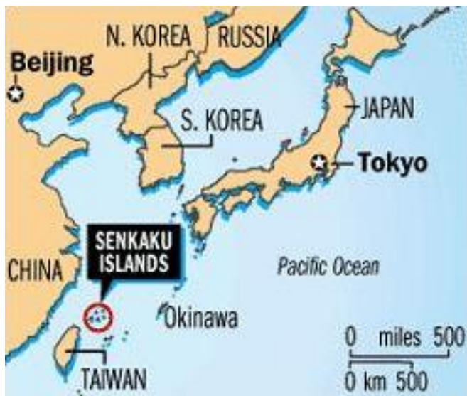
รูป ที่ตั้งหมู่เกาะเซนกากุ (Senkaku Islands)

หมู่เกาะนี้เดิมญี่ปุ่นครอบครองอยู่ช่วงสงครามโลกครั้งที่ ๒ แต่หลังจากแพ้สงคราม สาธารณรัฐประชาชนจีนได้ประกาศครอบครองเช่นเดียวกับไต้หวันแต่ญี่ปุ่นคัดค้านและยังคงอ้างว่าเป็นของตนเอง ที่ตั้งของหมู่เกาะอยู่ระหว่างจีนแผ่นดินใหญ่ เกาหลีใต้ และเกาหลีเหนือของญี่ปุ่น บริเวณรอบๆหมู่เกาะนี้เชื่อกันว่ามีก๊าซปิโตรเลียมอยู่เป็นจำนวนมาก ความขัดแย้งนี้นอกจากในระดับรัฐบาลแล้วยังลามไปถึงกลุ่ม NGOs และประชาชนของทั้งสามชาติที่มีการเคลื่อนไหวประท้วงซึ่งกันและกันอยู่เป็นประจำในขณะนี้