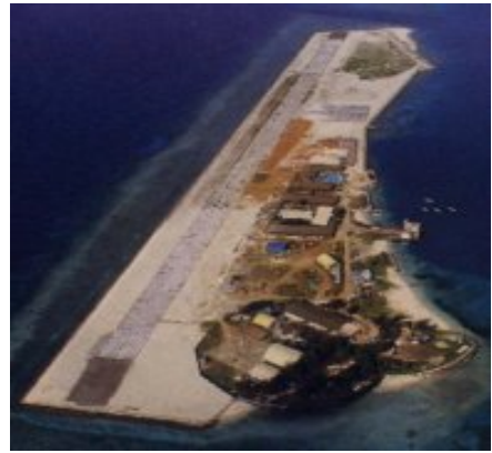
รูป สิ่งปลูกสร้างของมาเลเซียบนไซดหิน Swallow Reef