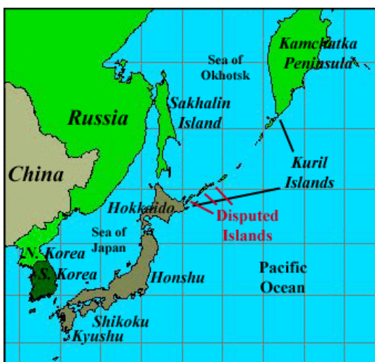
รูป ที่ตั้งหมู่เกาะคูริล(Kuril Islands)

การอ้างสิทธิ์เหนือหมู่เกาะคูริล (Kuril Islands) ระหว่างรัสเซีย - ญี่ปุ่น