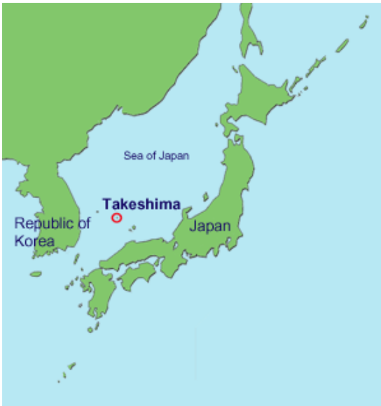
รูป ที่ตั้งหมู่เกาะทากิซึมา หรือ ต็อกโด ( Takeshima /Tok-do Islands)

หมู่เกาะทากิซึมา(Takeshima) หรือเกาหลีใต้เรียกว่าเกาะต็อกโด (Tok-do) ตั้งอยู่ระหว่างคาบสมุทรเกาหลีและญี่ปุ่น อยู่ทางตะวันออกเฉียงเหนือของเกาหลีใต้ประมาณ ๘ ไมล์ และห่างจากตะวันตกเฉียงเหนือของญี่ปุ่นประมาณ ๓๐ ไมล์ ญี่ปุ่นได้ประกาศครอบครองหมู่เกาะนี้ตั้งแต่ปี ค.ศ. ๑๙๐๕ แต่พอหลังสงครามโลกครั้งที่ ๒ ญี่ปุ่นแพ้สงครามจึงหลุด