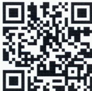
QR code 3 เว็บไซต์ http://dg-sa.tpqi.go.th/Home สำหรับเข้าไปทำการประเมินฯ