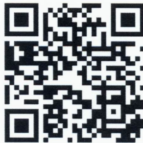
QR code 2 เว็บไซต์ https://tdga.dga.or.th/index.php/th/ สำหรับเข้าอบรมหลักสูตร e - Learning ของ TDGA