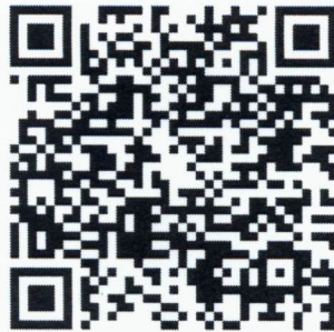
QR code 1 เอกสารต่าง ๆ ที่เกี่ยวข้อง

๔. รายละเอียดเพิ่มเติมสามารถประสานได้ที่ น.อ.นราพงศ์ อาจปัฐ รอง ผอ.กศช.สพพ.กพ.ทร. โทร. ๕๕๔๘๕ หรือโทรศัพท์เคลื่อนที่ ๐๘ ๖๗๘๔ ๕๐๗๒