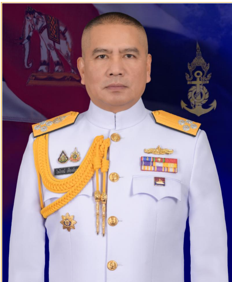
พลเรือเอก ไพโรจน์ เฟื่องจันทร์ ผู้บัญชาการทหารเรือ